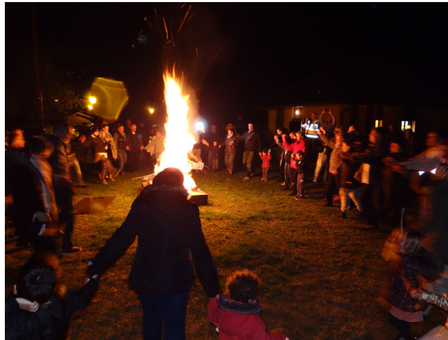
Les failles 2017

Partageons-le avec nos enfants, dans une belle farandole pour brûler l'hiver, par exemple :