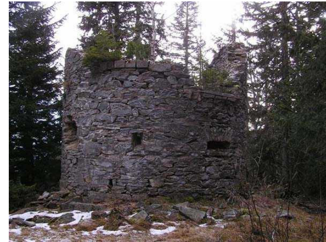
Le Poste Optique aujourd'hui